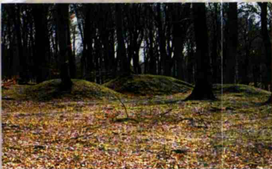
Starożytne kopce grobowe (kurhany), Runowo - Pomorze Środkowe

Zabytkiem archeologicznym jest wszystko to, co spoczywa w ziemi lub na jej powierzchni i co jest pozostałością dawnej działalności człowieka.