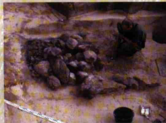
Fragment wczesnosłowiańskiej ziemianki z pozostałościami kamiennego pieca, Hački - Podlasie

Wielkim zagrożeniem dla zabytków archeologicznych jest wszelka działalność budowlana : w tym ogromne inwestycje, jak budowa gazociągów, autostrad, czy zakładów przemysłowych. Zalicza się do nich także choćby kopanie rowów fundamentowych pod wiejskie budynki gospodarcze, domek na działce, czy sklep. Kopiąc w ziemi odkryć można pozostałości dawnych budowli, cmentarzy, czy obozowisk - natrafić można wtedy na ludzkie szkielety, fragmenty naczyń, skorodowane i bezkształtne przedmioty metalowe, monety lub wyroby krzemienne w postaci np. wydłużonych, płaskich wiórów.