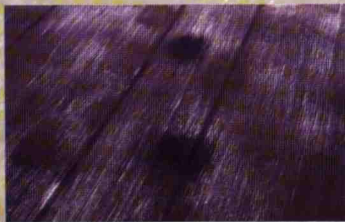
Zniszczone intensywną uprawą roli kurhany - Zamojszczyzna

Pozorna wartość materialna takich znalezisk nie zawsze odpowiada ich wartości naukowej - wprost prze-